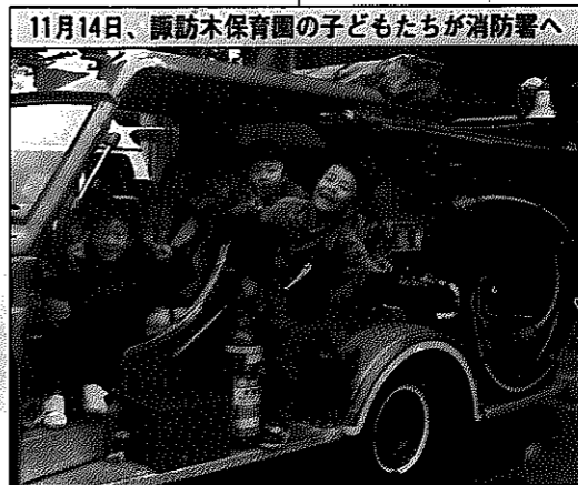
11月14日、諏訪木保育園の子どもたちが消防署へ

3...市内小学校親善水泳大会 8...ふるさと創生アイデア入選作品が決定(フルーツ王国の建設、白根市一周サイクリングロードの建設、ふるさと園路の整備、白根ふるさと館の建設、ふるさと基金の創設) 17...市制30周年記念大相撲白根場所 26...全国少年少女陸上研修大会で薫風クラブ(白根小)が400mリレーで優勝 27...ちびっ子相撲大会