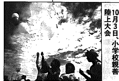
10月3日、小学校親善陸上大会

3...市環境衛生協会白根支部が空き缶、空き瓶回収/小学校親善陸上大会 4...北部ガス供給所が稼働開始 6...県警防犯指導車「青空号」が防犯指導 8...はつらつオートムボウリング大会に、約100人の男女が参加 11...全国西洋ナシ研究協議会開催 13...第13回社会福祉大会開催 17...基礎試練「新潟平野」掘削開坑式 23~25...第4回老人クラブ作品展 27...市連合婦人会役員が一日消防署長・署員を体験