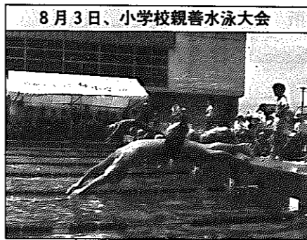
8月3日、小学校親善水泳大会

1...市制施行30周年を迎える/30周年記念たばこ発売/ふるさと創生アイデア審査委員会が発足/子ども大風合戦 1~6...第17回市展 2~6...30周年記念大風合戦、さじき舟を設置、優勝は謙信組 4...県知事選挙、金子清さんが当選、本市投票率は72.96% 9~22...30周年記念巡回市展(大郷・茨曾根) 14...早朝、戸石小学校の木造2