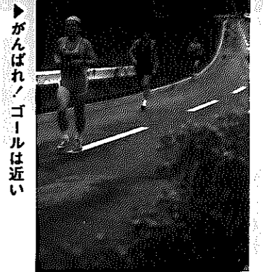
がんばれ、ゴールは近い