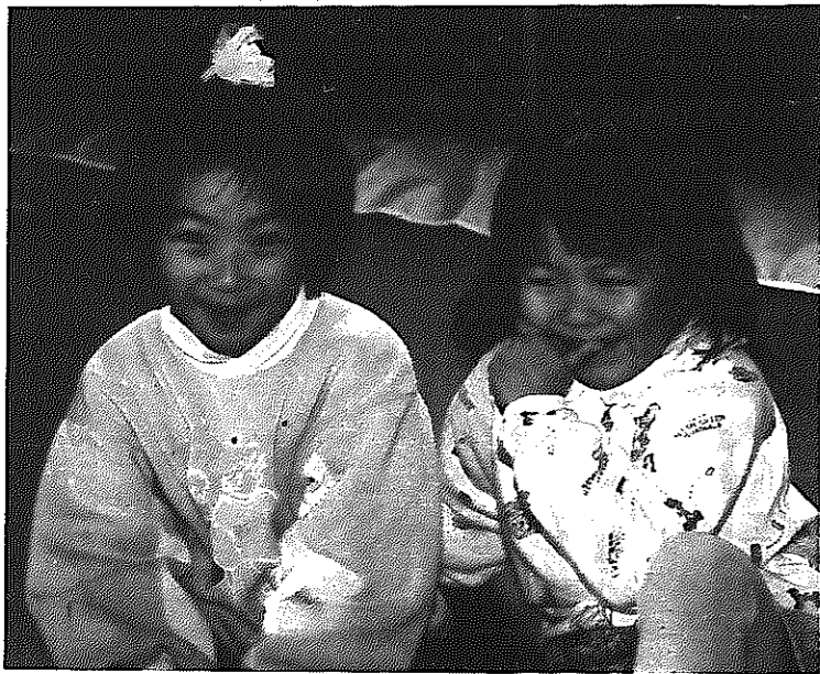
▲健康な笑顔が何よりの宝

福祉 市民の皆さんが健康で文化的な生活を送ることができることを基本に、市の実情に即した施策を推進します。 地域福祉・在宅福祉サービス事業を実施 着実に進む高齢化に対応するため、本年度から地域福祉・在宅福祉サービス事業を実施します。この事業は、寝たきりや一人暮らしのお年寄り、障害者などのために、地域の皆さんの参加と協力を得ながら、在宅福祉の推進を図ることを目的としています。ボランティアグループなどを育成し、家事や看護などのサービスを行うための予算二百万円を計上しました。