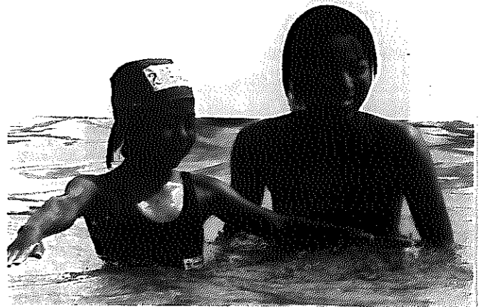
▲「泳げるよ!」(親子水泳教室)

社会教育 生涯学習推進体制の整備 生涯学習の気運が盛り上がり、現在、市民の多様な学習要求に対応した施策が求められています。いつでも、どこでも、生涯を通じて主体的、体系的に学習できる教育環境条件の整備を進めるために、社会教育の分野だ