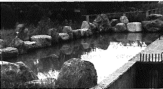
戸頭浄水場に原水水質監視池を設置しました

不足する額1億5,255万円は、当年度分損益勘定留保資金、減債積立金、建設改良積立金で補てんしました。