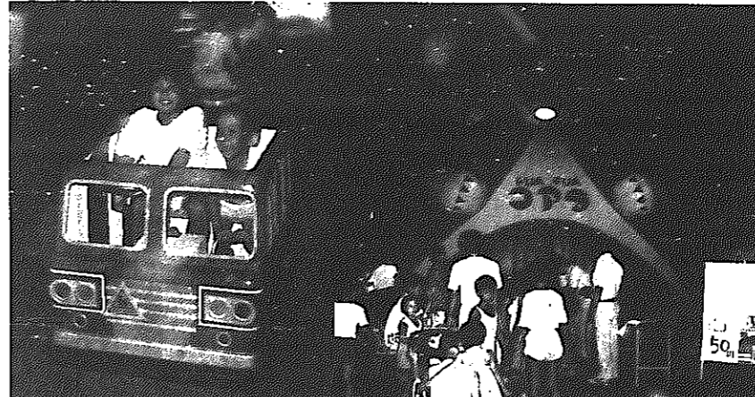
フアアアコアラ、バッテリーカーは子供たちに大好評。どちらも500人余りが集まった