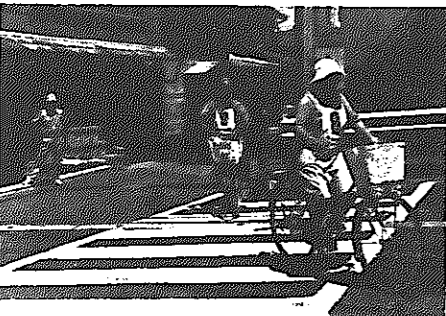
お年寄りの自転車交通安全大会