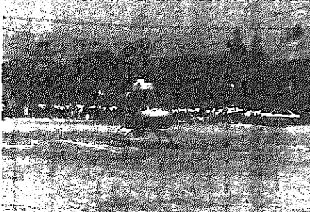
県警ヘリを出迎える新飯田小学校児童

お年寄りに自転車のマナーを 一方、白根地区交通安全協会白井支部では、ヘリコプターを出迎える児童や園児、母の会の人たちが集まった機会に地区の老人クラブ員にも来てもらい、ヘリコプターの去った後、「お年寄りの自転車交通安全大会」を開きました。お年寄りの交通安全のため初め