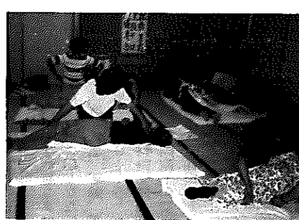
寝たきり病人の看護法を学ぶ大郷婦人学級の皆さん

婦人の自主的な学習と仲間づくりを進め、生活改善や女性としての教養を高めるため、いろいろな婦人の学習グループを募集しています。あなたも、お友達と学んでみませんか。 開設期間 四月から翌年三月まで(短期間の開設もできます) 開設場所 地域生活センターや部落集会所などを使います。 対象と学級編成 市内に住む婦人十五人くらいのグループから開設できます。 学習時間 年間二十時間くらい。 学習内容 学習目標を掲げ、具体的な学習計画を