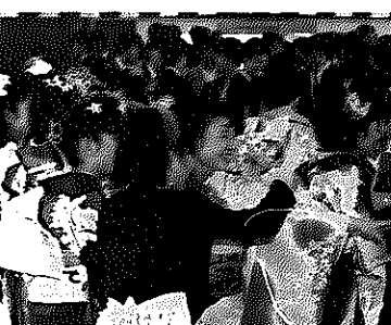
今年の成人式では、式典終了後、実行委員の企画でレクリエーションを実施

新規に購入したい人の受付も行っていきます。先着順ですので、お早めに市史編さん室(☎2089)へ連絡してください。