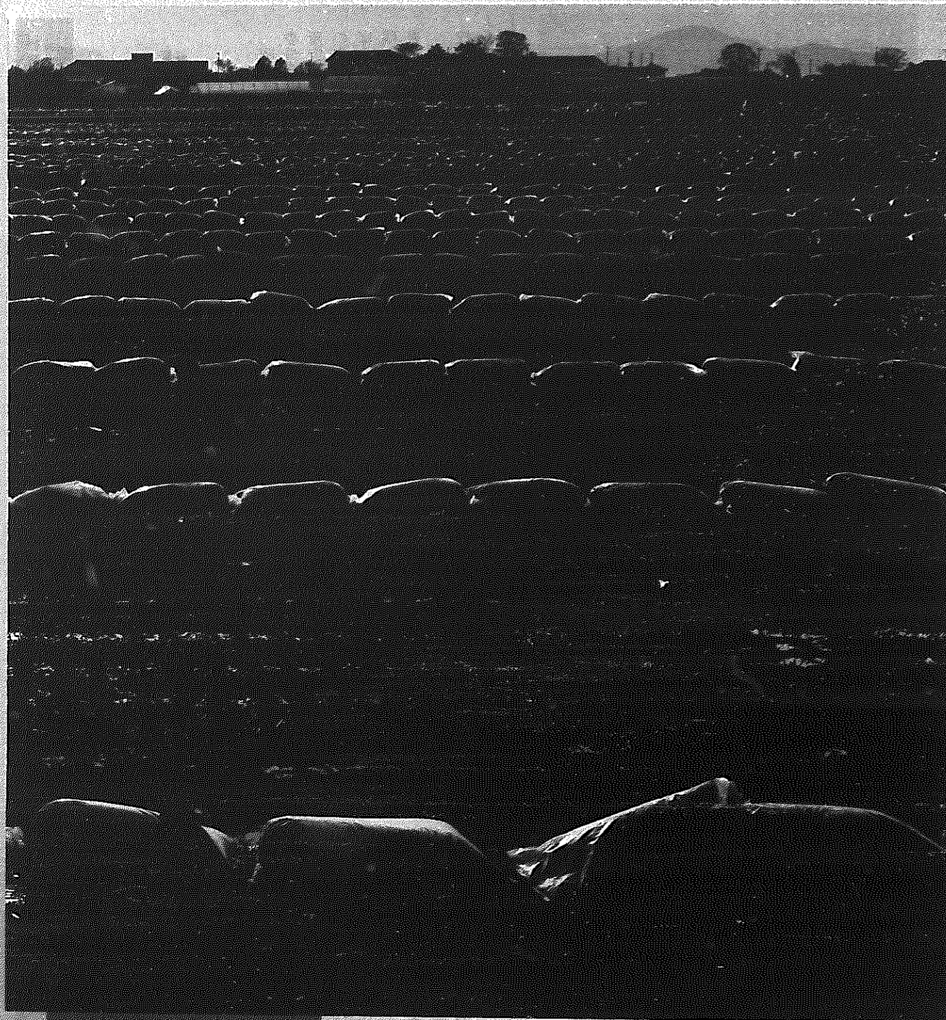
さとのうた ⑬ 光景