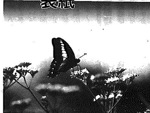
写真と文 写友「しろね」会員 松尾勝栄さん(みの口)

花や虫の接写を楽しむには、マクロ(接写用)レンズや中間リング、クローズアップレンズを用意することは当然ですが、表紙の写真ではこれに反し、1,200ミリの超望遠で風に揺れる花とアゲハチョウを写しました。何よりも、作品の表現意図を明らかにし、写す花が傷んでいたたり花卉が1枚でも足りなかったりして特長が失われているものは避けるようにしています。