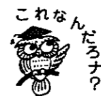
これなんなんナナ

スーパーに売られているウニは卵巣です。海の中で受精が行われると、卵という1つの細胞が2つに割れ、それが4、8と倍々に増えます。さらに増えると、体の形を変えながら(写真はその1つで、ウニになる前の形)、1か月以上かかって小さなウニになります。