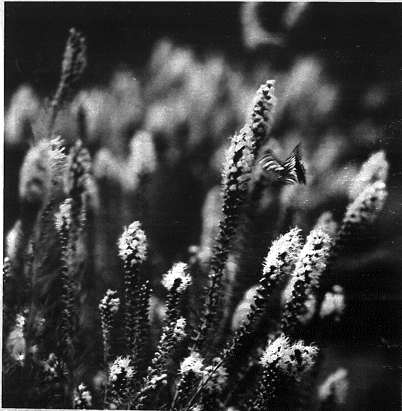
さとのうた ⑫ 花誘いチョウの舞い