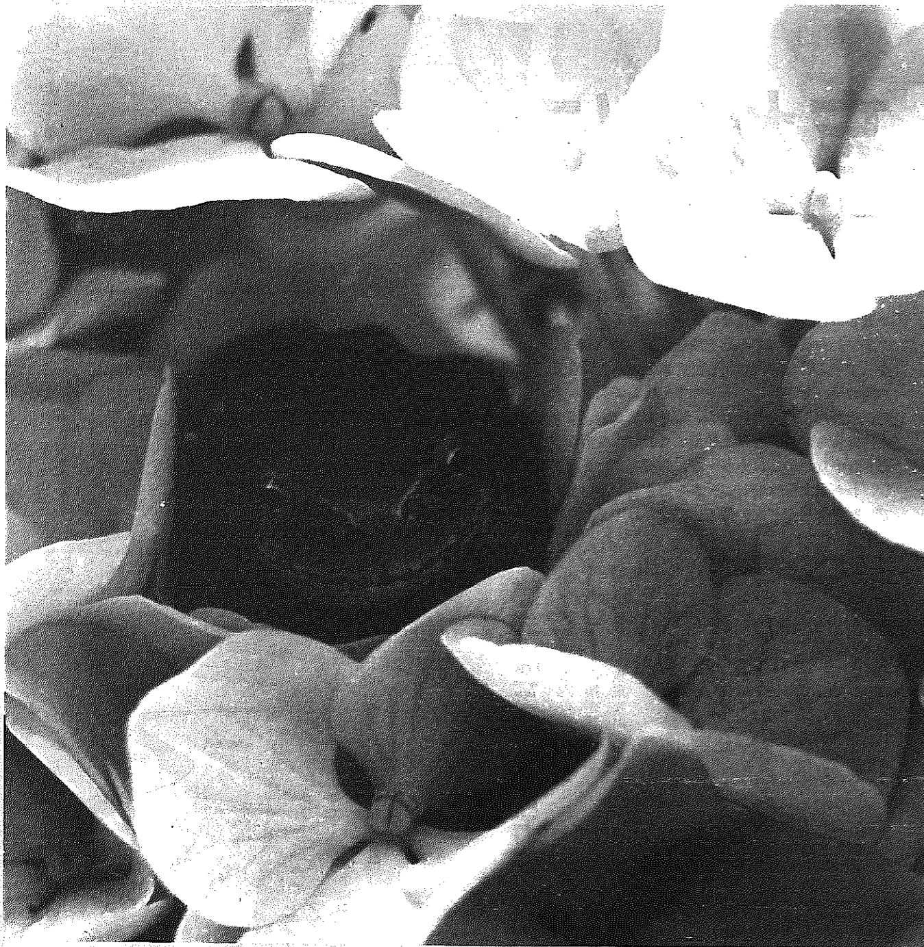
さとのうた ⑩ カエルとあじさい