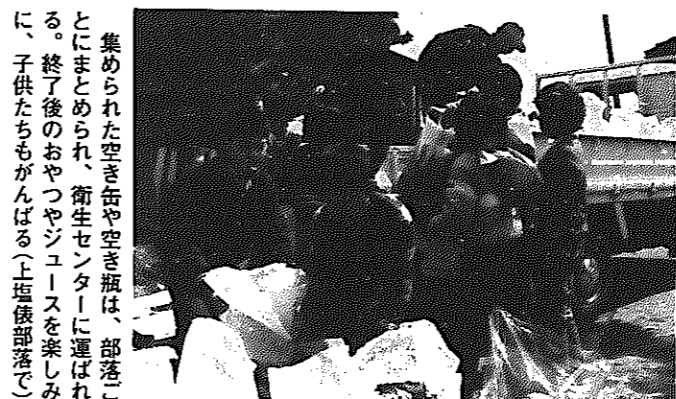
集められた空き缶や空き瓶は、部落ごとにまとめられ、衛生センターに運ばれ、終了後のおやつやジュースを楽しみに、子供たちもがんばる(上塩俣部落)

住みよいきれいなまちをつくるため、地区が一体となって、道路などに投げ捨てられた空き缶の回収に取り組んでいます。これは、五十九年度から始められたもので、年々実施する地区が増え、今年