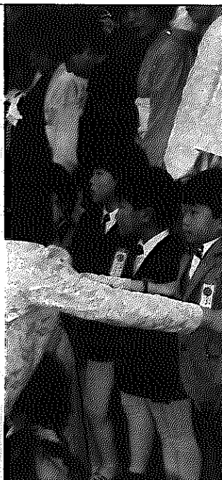
写真と文は関係ありません

「遊んでんなネー」というリーダーの声で、今日も二十分間の水ぶき清掃が始まる。五年生以下の下級生は、六年生のリーダーの指示に実によく従う。その点では、先生の力も及ばぬ(?)ものがある。 校外での子供の集団遊びが減