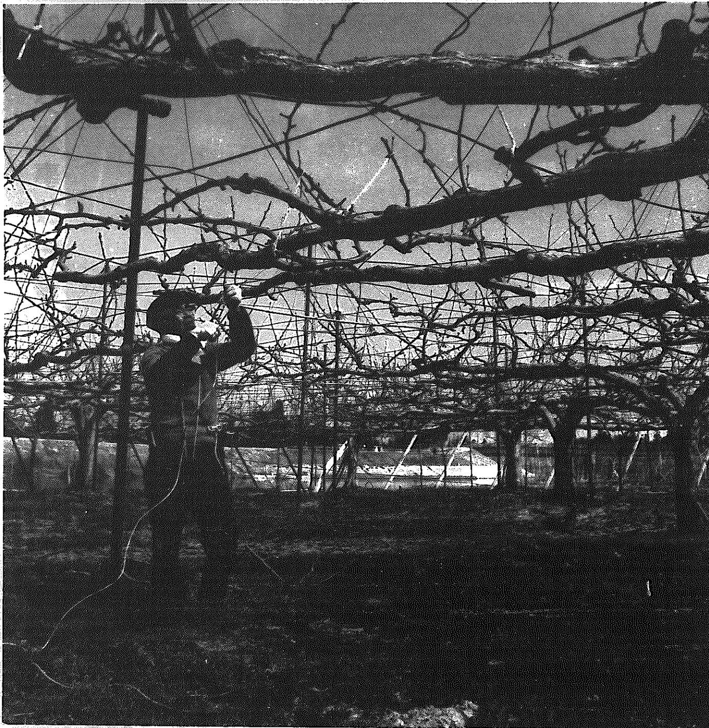
さとのうた ⑨ 枝えつけ