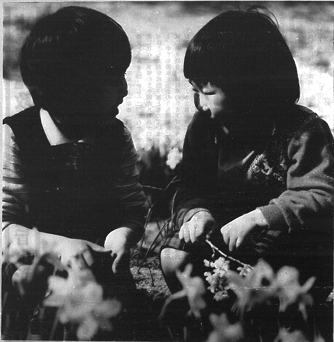
さとのうた ④ なかよし