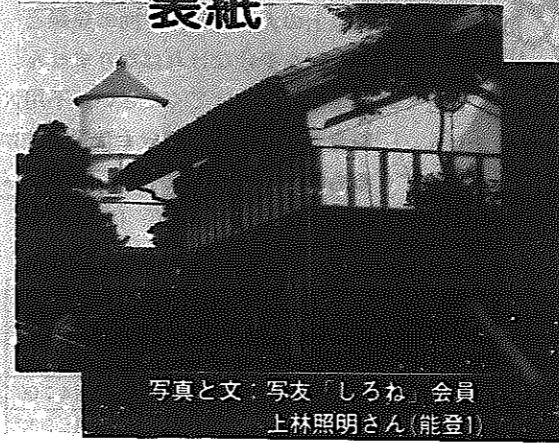
写真と文：写友「しろね」会員 上林照明さん(能登)

表紙の写真は、市内を車でドライブしていた時、ふと車窓から少女が楽しげに遊んでいる姿が見え、早速、愛用のカメラに200mmズームレンズを取り付けて、花を手前に数枚撮った中の1枚です。子供の遊んでいるときの表情は、なんともかわいく無邪気で、思わずシャッターを切っていました。早春の香りと少女たちの詩声を感じてもらえれば幸いです。