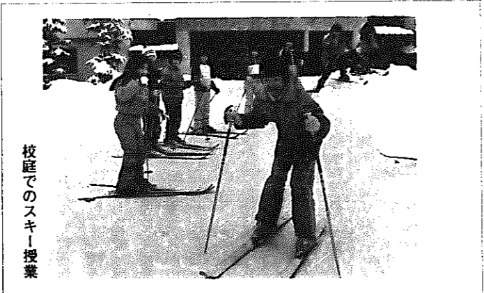
校庭でのスキー授業

新飯田小学校では、毎年学校行事に「スキー教室」を取り入れています。 今年も、二月十八日に長岡市のスキー場へ出かけてきました。これは、四年生以上を対象に十一年前から行われているもので、地区のスキークラブ員が同行し、直接指導に当たってくれます。 また、同校では毎年、この教室と併せ、体育の時間にスキー授業を行っています。平地や、除雪で高く積まれた雪の山を利用し、スケート滑降や滑走の練習をします。「足で雪を捕らえる感覚が身に着くようです。年々上達している」と学校では話しています。