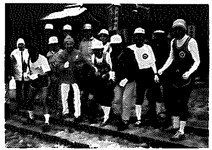
弥彦神社を参拝し、スタート!

一月二日、「弥彦初もうでマラソン」が行われ、寒風が吹き荒れる中、集まった参加者は、弥彦神社を参拝後、白根までの二十五キ