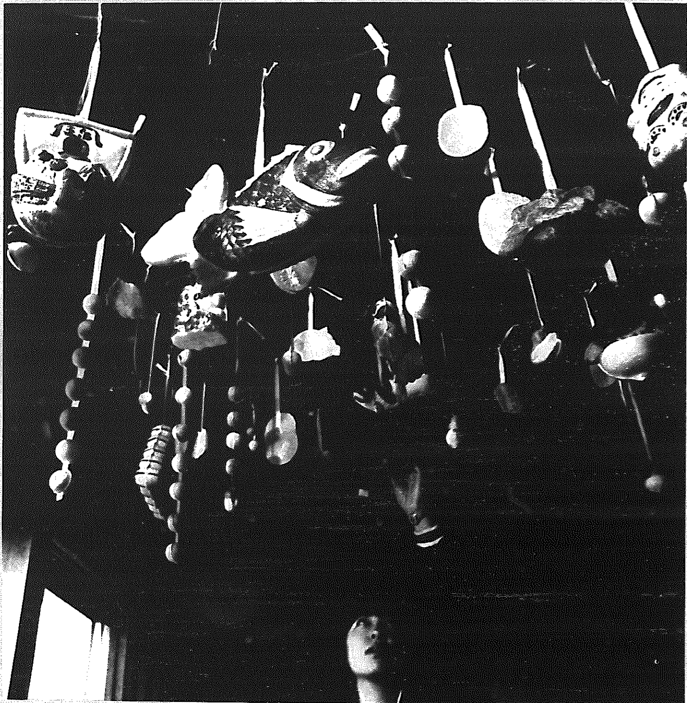
さとのうた ⑥ まいだま飾り