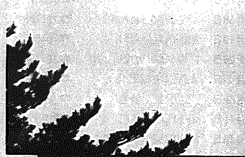
写真と文 写友「しろね」会員 松尾勝栄さん(みの口)

私は、仕事で早朝に帰宅することがあり、日の出や早朝の風景をしばしば撮影することがある。一口に日の出と言っても、雲をひきつけ力強いのぼる時もある。朝霧の中に穏やかに立ちのぼる時もあり多様である。日ごとに時と場所を変える太陽は、目にすると美しい。ともあれ元旦の初日ともなると、その年の吉凶を占うかのように大勢が目になる。