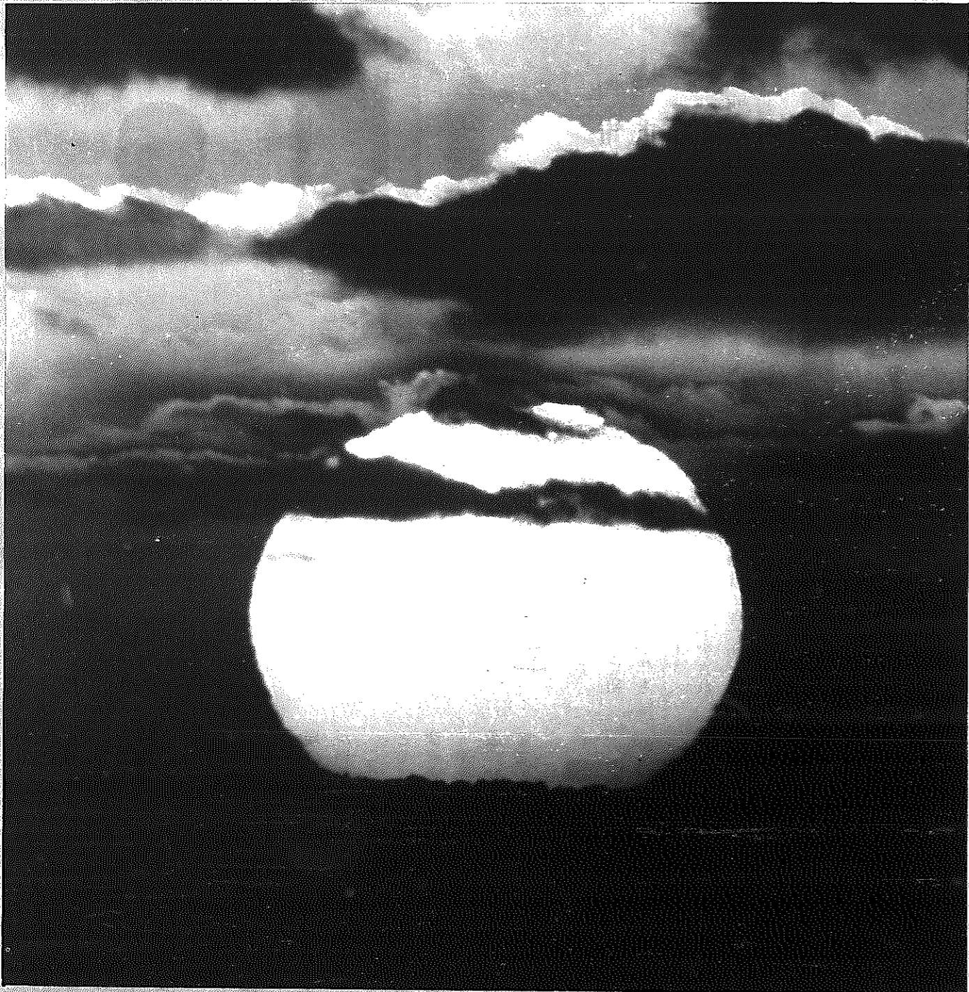
さとのうた ⑤ 日の出