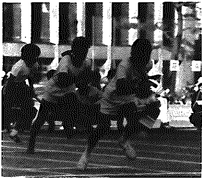
▲市内小学校親善体育祭