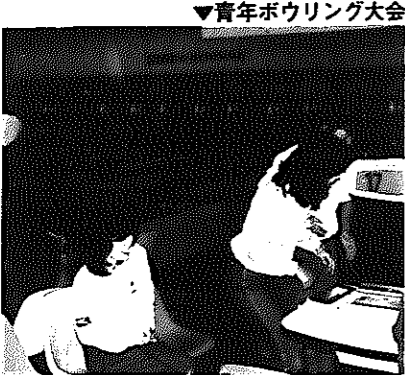
▼青年ボウリング大会