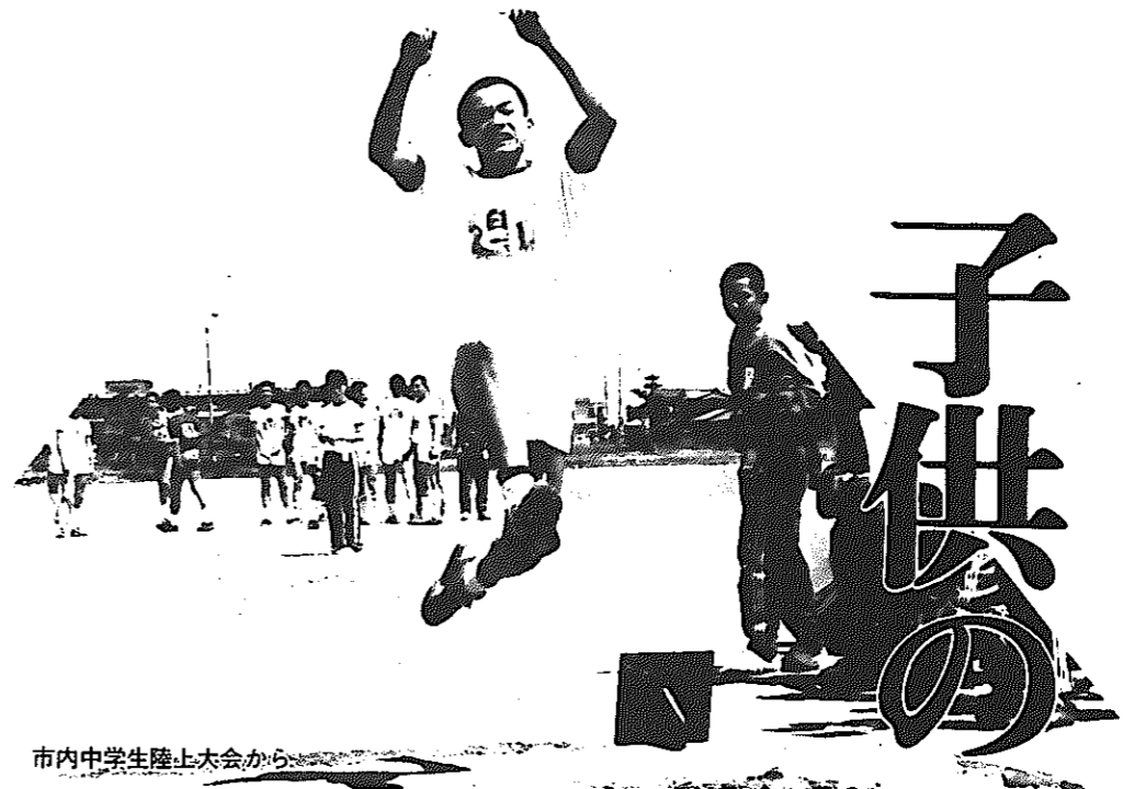
市内中学生陸上大会から

青少年の非行が、深刻な社会問題のひとつとなっています。しかし、聞こえてくるのはいつも大人の声ばかり。いちばん大切な子供たちは、非行問題や大人社会などをどう考え、どう見ているのでしょうか……。そこで、同世代の子供たちの声を聞いてみました。