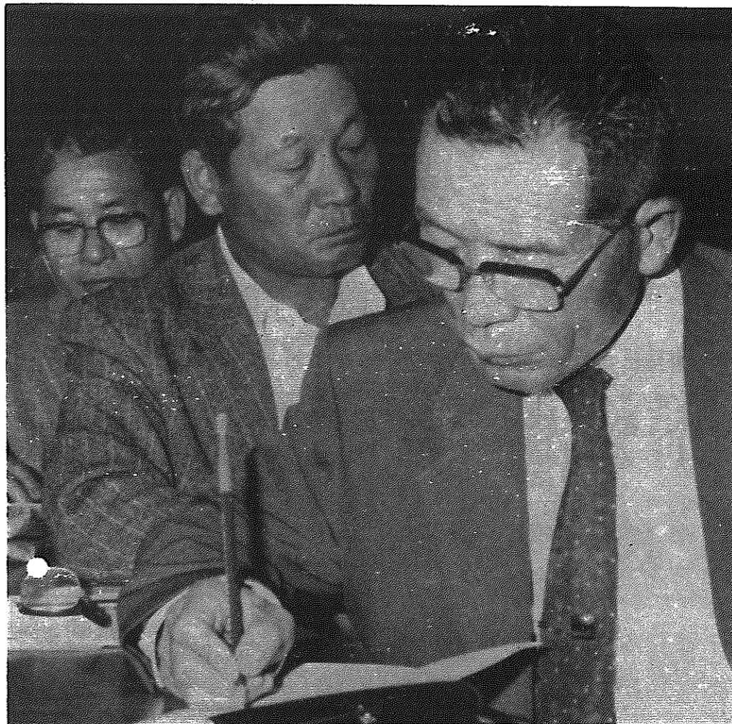
5月24日に行われた「囀託員連絡会議」から