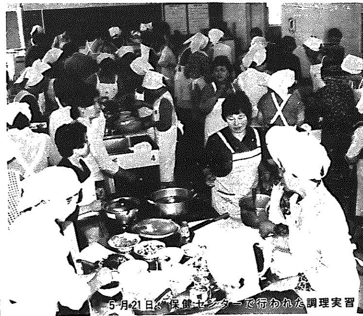
5月21日、保健センターで行われた調理実習

皆さんの食生活の改善や健康づくりのため、市から委嘱された八十三人の食生活改善推進委員が、活動を続けています。食生活は、健康づくりや生活の基本です。しかし最近、食生活が豊かになった反面、生活様式の簡素化やリズムの乱れから、食事を抜いたり誤った食べ方をしている栄養不足となったり、