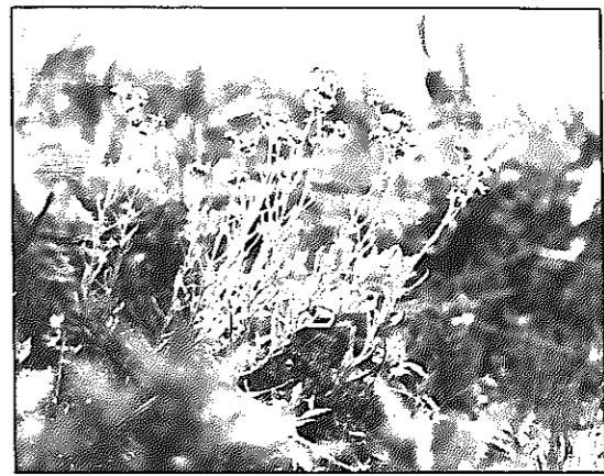
ホウコグサ (キク科)

の町と対岸の西白根を結び、味方村との経済流通と、電鉄を利用する人たちにとって、欠くことができなかった富月橋。その橋も48年10月に姿を消し、約70m下流に、新しく「凧見橋」と名付けられた歩道橋が完成したのは、49年春のことでした。この橋は長さ82m、幅5mの永久橋で、大嵐合戦期間中には、多くの見物客に利用されています。