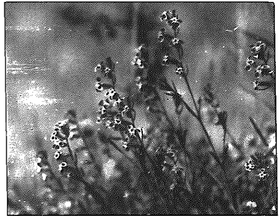
マンテマ (ナデシコ科)

かさかさとした感じで、茎や葉に毛が多い。庭園に植えられていたものが、野生化したヨーロッパ原産の帰化植物である。ナデシコ科の葉は、同じところから2枚でて(対生)、ふちにぎざぎざがないのが特徴である。