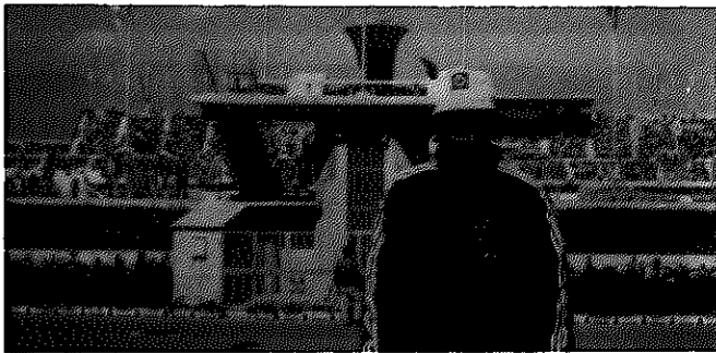
滋賀国体メイン会場をバックに