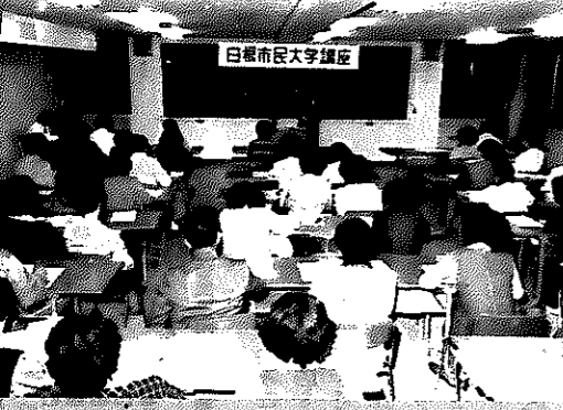
日新市民大学講座

9月17日から、「幸せな暮らしを求めて」をテーマに市民大学講座が開かれます。みなさん、ふるってご参加ください。 □資格 20歳以上の人 □教材費 1,500円 □会場 青年教育センター視聴覚室 □時間 午後7時30分～9時30分まで（9月17日は午後7時15分から、11月8日は午後9時45分まで。10月24日は午前9時から午後2時まで） □申し込み 9月4日までに中央公民館（☎③3171）か地区公民館へ。