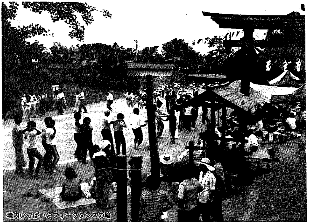
境内いっぱいフォークダンスの輪