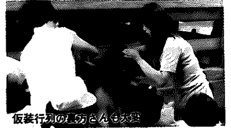
仮装行列の風物さんも大変