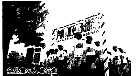
全児童の入場行進