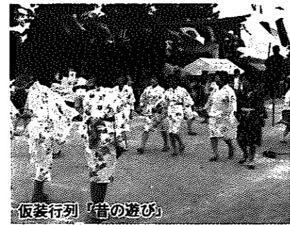
仮装行列「昔の遊び」