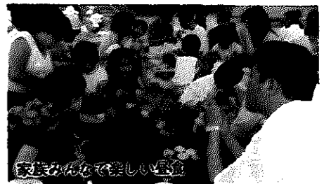
家庭みんなで大変楽しい運動会