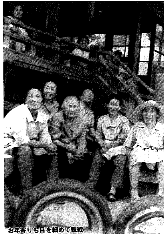
お年寄りも目を細めて観戦