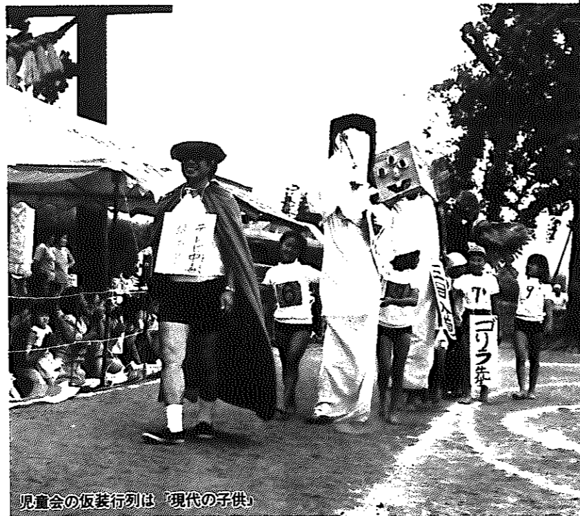
児童会の仮装行列は「現代の子供」