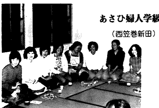
あさひ婦人学級 (西笠巻新田)

「元気で明るい子供に育てるには」を年間目標にかけ、現在、子育て真っ最中の婦人が上塩俵婦人学級生(三十七人)です。学級誕生一年目の若いお母さんたちは、熱い意欲に燃えてはりきっています。 □年間学習 ゲーム、フォークダンス、子供を伸ばす叱り方、ほめ方、両親・祖父母の子供に対する役割、親子からの性教育、礼儀作法、親子映画会ほか □日時・会場 毎月第三土曜日 午後七時三十分～九時三十分、根岸地域生活センター