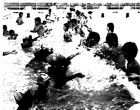
かなづちくん集まれ 親子水泳教室で泳ぎをおぼえよう

八月四日から十一日までの午後六時から八時まで(八日は午後一時から五時まで)、白根高校プールで親子水泳教室が開かれます。対象は市内小学校在学の子供とその保護者五十組で、受講料は資料代と保険料などを含めて千円です。申し込みや問い合わせは、七月二十日までに社会教育課体育係(☎③三七一)へ。定員になり次第、締め切ります。