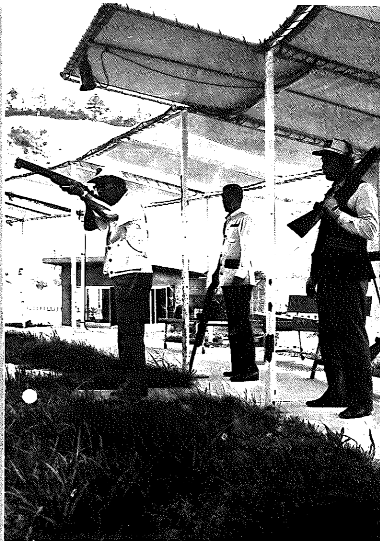
市体育協会加盟記念射撃大会を終えて