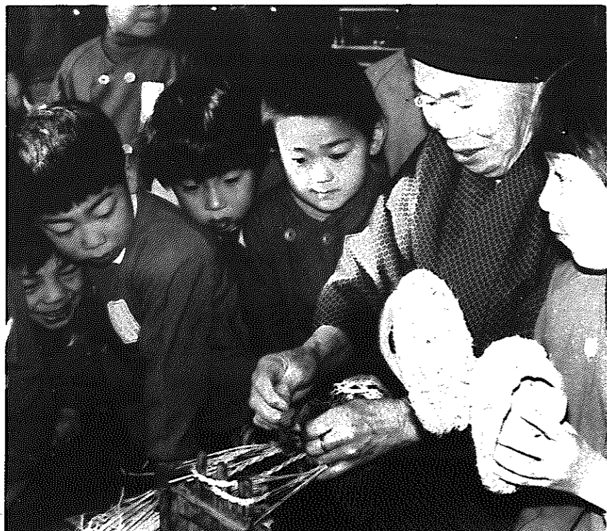
おばあさんを囲んで、ぞうり作りに見入る園児たち