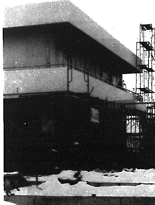
工事も急ピッチ、完成間近かな根岸地域生活センター

地区行事ができることで、講演会や各種講座、それにゲームの対抗試合など、考えることがふくらみます。長生きして、大いに使っていきたいと思う気持ちです。こうして地区ごとに建てられている地域生活センターは、産業厚生会館や青年教育センターを小型化した建物ですが、みんなの力でこのきれいなセンターを、大切にしていきたいのです。余命を最大限に、楽しく活用させていただきます。