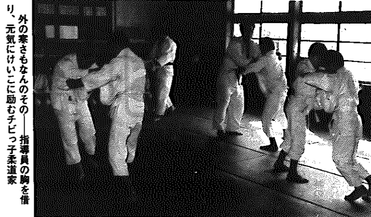
外の寒さもなんのそのー指導員の胸を借り、元気にけいこに励むチビっ子柔道家