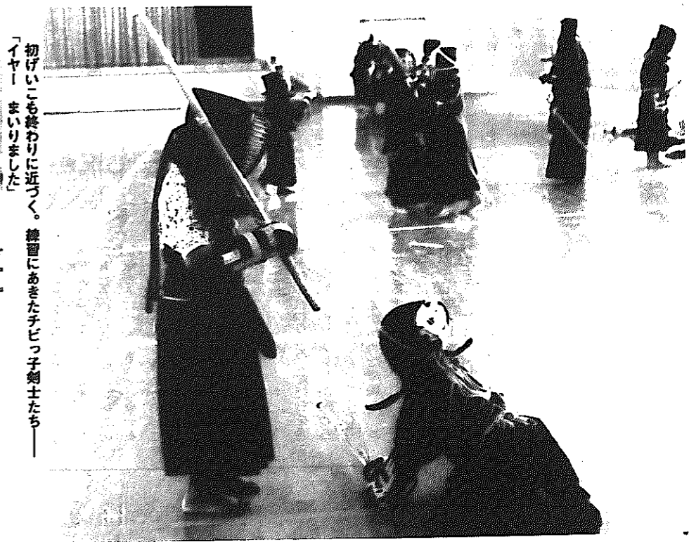
初げいこも終わりに近づく。練習にあきたチビっ子剣士たち「イヤー、まいりました」

裏日本には珍しい正月の快晴。ぬけるような真つ青な空はまぶしく、晴れているだけに寒さも厳しい。キーンと張りつめた空気が身をひきしめる。気合いの入ったかけ声と、竹刀のぶつかりあう音が体育館からひびく。 一月三日、白根小学校体育館で、市剣道連盟主催の剣道初げいこが、五十人の剣士を集めて開かれた。準備体操に始まり、基本練習、かりげいこ、互角げいこ進むにつれて、館内は熱気にあふれ、剣士の体からは湯気があがり始める。指導者や青年剣士たちは、すさまじい迫力で練習に汗する。 ところが、チビっ子剣士たちはいたって陽気。練習にあきる、竹刀をふりかざして鬼ごっこや、何やらそのそ話。 二時間あまりの練習を終え、紅白のおまんじゅうをもらって、上げげいの初げいこでした。