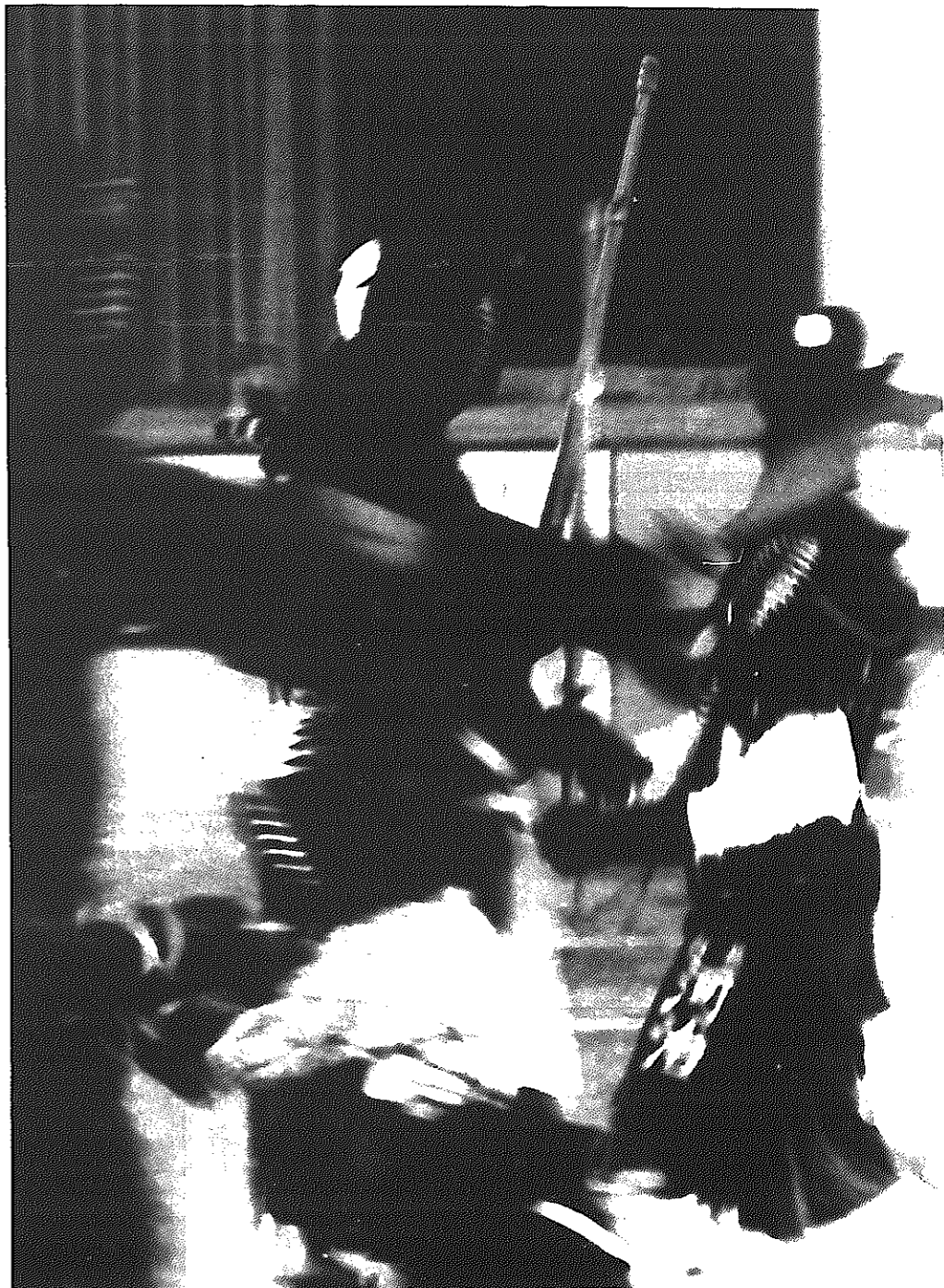
「ドオー」 気合いの入った激しいけいこ。一瞬の気のゆるみも許されない