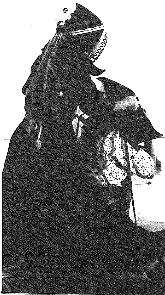
寒い。準備体操で冷えきった体をほぐしてから、練習は始まる