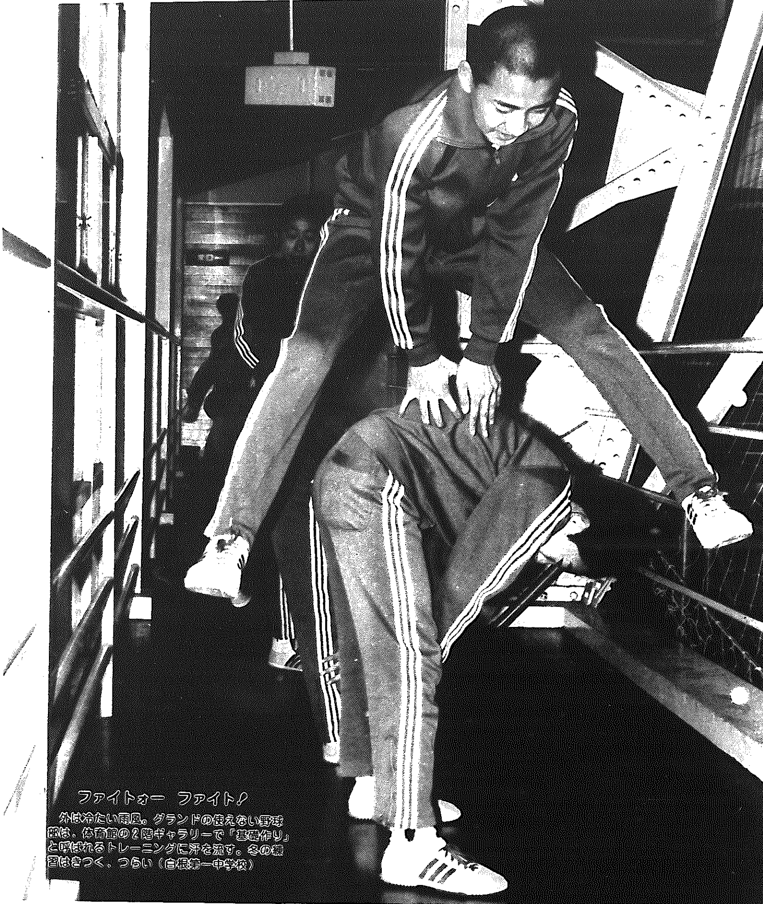
ファイトオー ファイト! 外は冷たい雨風。グラウンドの使えない野球部は、体育館の2階ギャラリーで「基礎作り」と呼ばれるトレーニングに汗を流す。冬の練習はきつく、つらい(白根第一中学校)