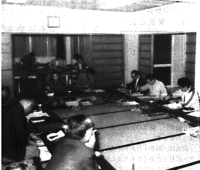
新しい地域生活センターで地域活動も活発に (庄瀬)

心のふれ合う町づくりをめざしてきた白根市は、地域コミュニティづくりの中心施設として各地区に地域生活センター(地区公民館)を建設し、みなさんからふれ合いをいっそう高めてもらおうと計画してきました。 そのセンターが、五十二年度に茨曾根、五十三年度に庄瀬、五十四年度に小林、五十五年度に白井地区に完成しました。今年度は根岸地区につくります。すでに用地を取得し、工事は九月から始められ、来年三月には完成する予定です。