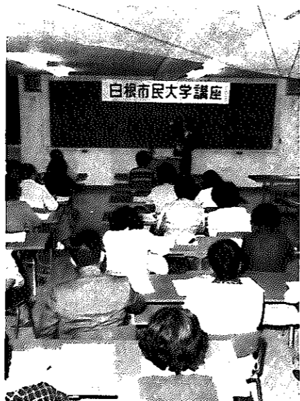
昨年の市民大学講座