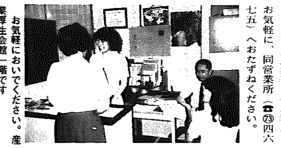
お気軽に、同営業所(☎四六七五)へおたずねください。産業厚生会館一階です。

市民の要望で、今年の四月一日に開設された日本鉄道旅行社白根営業所(産業厚生会館二階)は、市内で国鉄乗車券が買えること、大変好評です。まだ慣れないこともあって、その日の乗車券、指定券を買い求めに来る市民も多いそうです。電話などで申し込まれた場合、切符のお渡しは翌日になります。特急券、寝台券などは一か月前から、十五人以上の団体は六か月前からお買い求めできます。年末年始、お盆ごろの予約はお早目に。