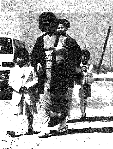
ピカピカの1年生、お母さんに連れられて入学式に。楽しい学校生活がはじまります