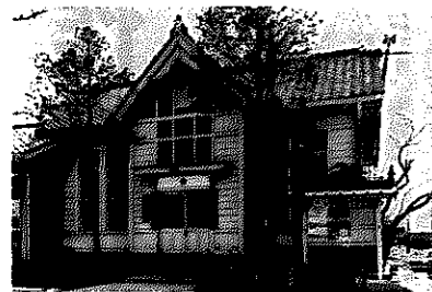
中央通りにあった旧警察署

昭和38年4月から、味方村と月瀧村が所轄管内として加わり、現在は44人の署員が、日夜を問わず、市民が安心して生活できるよう社会の秩序の維持に努めています。