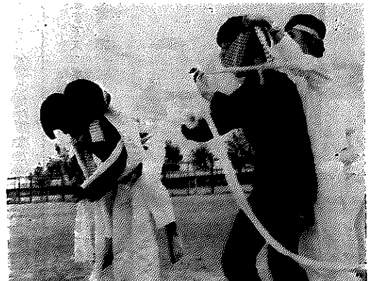
夜間で学ぶ生徒たちの運動会。楽しさもまた格別

閉課程記念式典は 3月8日に 閉課程記念式典は、3月8日午前10時から白根高校体育館で行われます。席上、記念品の贈呈や別れの宴も開かれます。また、定時制18年の思い出をつづった記念誌も発行されます。