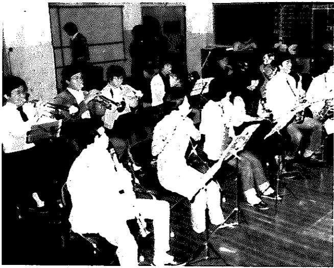
グループ・サークル活動の拠点として利用される研修室

公民館は、一人ひとりが自らの教育を進める社会教育の場です。中央公民館には、六つの研修室（一つは和室）があり、毎日会議やいろいろなグループ・サークル活動の場として利用されています。