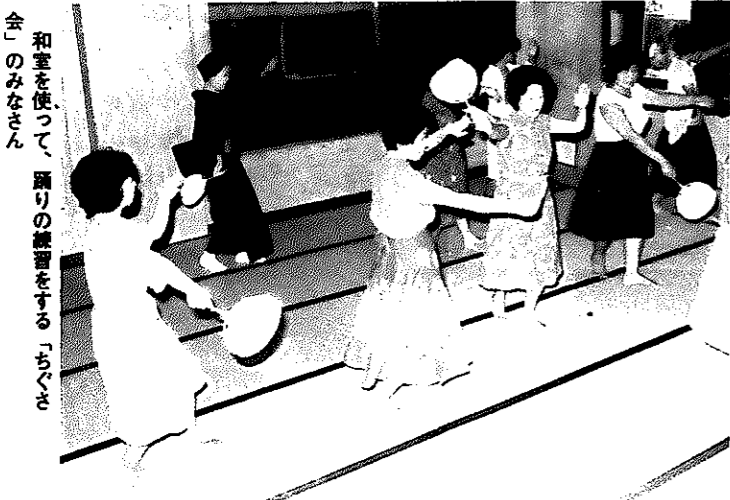
和室を使って、踊りの練習をする「ちびっこ会」のみなさん