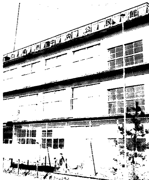
みなさんの茶の間として活用を