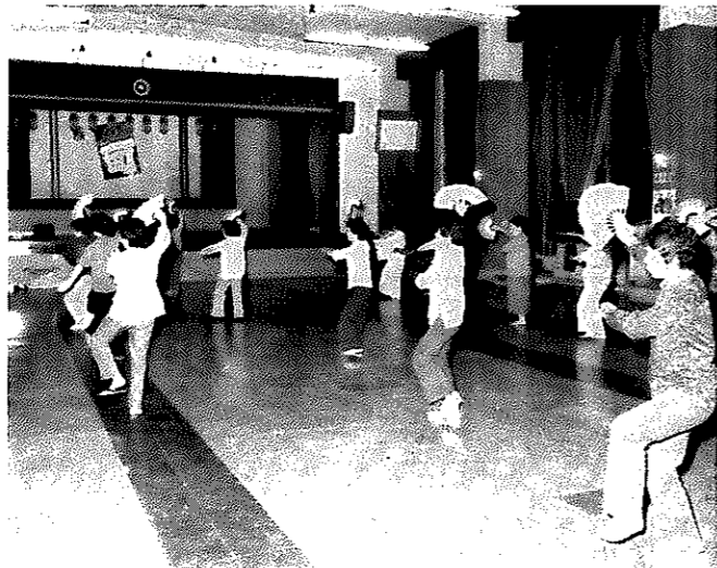
いろんな催しに利用される講堂。音響設備もバッチリです