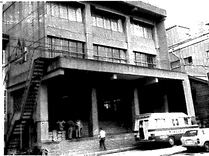
毎日多くの人が訪れる産業厚生会館