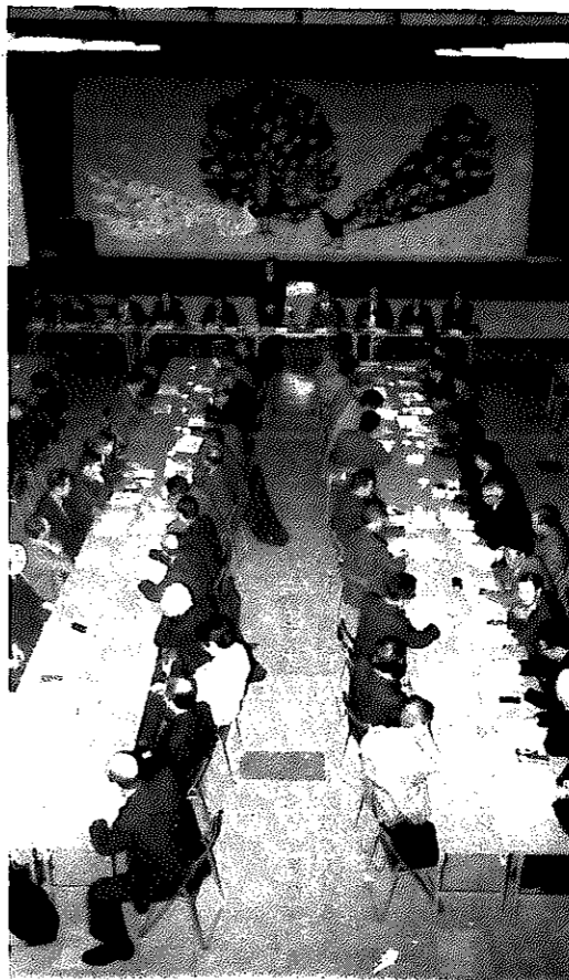
会議や催し物は定刻に始めたいもの。みんなそう思っているのでしょうか……

定刻で始まる会議や催し物。そこにあたたかい人間同志の信頼と結束が、必ずや生まれてくるものと信じています。みなさんはどうお考えですか。