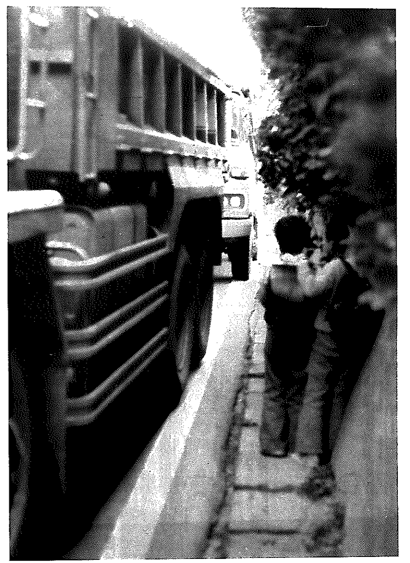
「アッ危ない！」大型車がすれちがうとき、こんな光景が何度も見られます