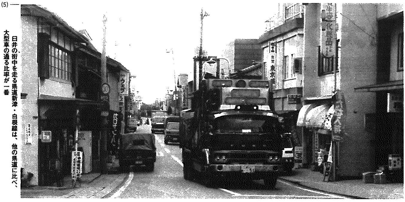
白井の街中を走る県道新津・白根線は、他の県道に比べ、大型車の通る比率が一番

ろうといっています。このため、完成はいつになるかという見通しは、はっきりたてられません。しかし、現状から考えて一日も早く完成できるように、積極的に国に働きかけていきます。