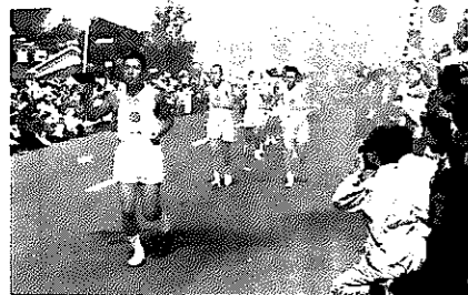
沿道の熱い声援の中を走る聖火

澄みきった秋空のもと、取り入れたけなわの穀倉地帯にまっすぐのびる国道8号線を、聖火ランナー隊はひた走り。沿道では稲刈りの手を休めての声援、各引き継ぎ地点や市街地では、日の丸の旗や五輪旗を手にした人波でいっぱいでした。