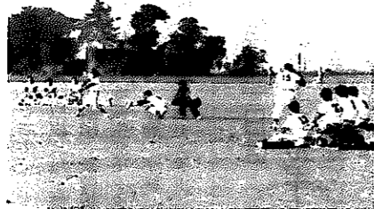
総合体育施設で野球を楽しむ

市民一人に使ったお金 二〇三、五八三元 市民一人が納めたお金 三六、七四四円 税負担の金額は課税額です。 人口は五十五年四月一日現在 三三、五四九人で計算しました。