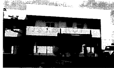
小林地域生活センター

主な建設事業 総合体育施設用地の取得と造成 一〇億四、二四万円 白根小学校の改築 三億九、五八五万円 大通小学校の建設 一億〇、〇三七万円 新飯田小学校の改築 七、八三六万円 庄瀬中学校体育館の改築 六、五八一万円 学校プールの建設 五、三七八万円