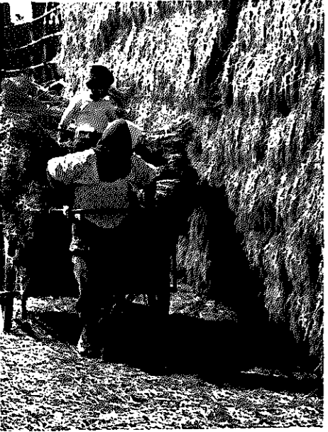
「大丈夫かい!」に、「しゅっぱ〜つ! しんこう」の声ひびく。収穫のよるこびにひろがる親と子のふれあい。いまは見れない情景

【相談】 夏バテがひどいのですが、その回復法を。 【ひとこと】 夏バテは、慢性疲労の一種で、早く立ち直るには、まず食べ物です。弱っている胃腸には、量より質を考え、良質のたんぱく質をとるよう心がけ、新鮮な野菜でミネラルビタミンも。入浴や適度な運動で血液の循環をよくし、睡眠を十分にとってください。夏バテが強いようでしたら医師の診察を。