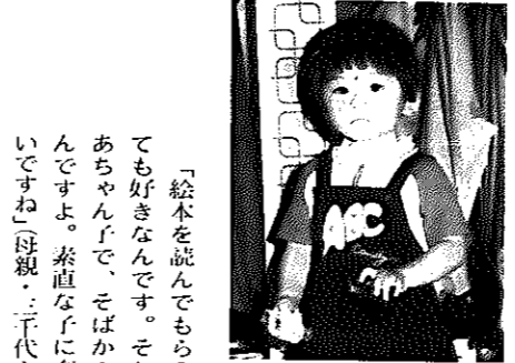
わが家のアイドル