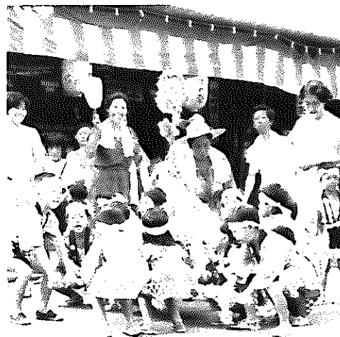
「ワッショイノワッショイノ」「それっ、がんばって」子どもみこしにお母さんも応援

「人の話を良く聞きなさい」「人の身になって考えなさい」「それから自らを見なさい」