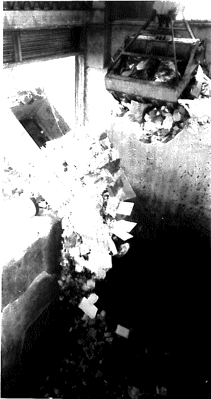
燃えない水を燃やそうというものですから、焼却炉はあえぎ、能率は大きく低下します。石油資源の乏しいとき、もったいない話です