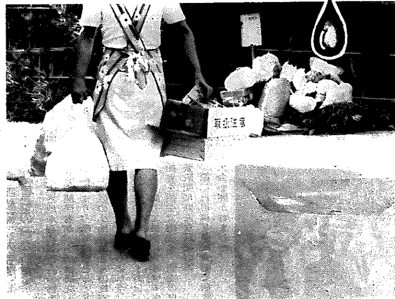
奥さまノ水切りはやっていただけましたか? それに、集積所はいつもきれいにしておきたいものです

センターでは、帰ってくる収集車が、いったん束になった枝豆だけをトラックに移しかえて、敷地内に広げて秋まで干してから、焼却するという大変な作業をしています。できれば軒先で干してから出し、農家ではたい肥に使ってほしいとのことでした。